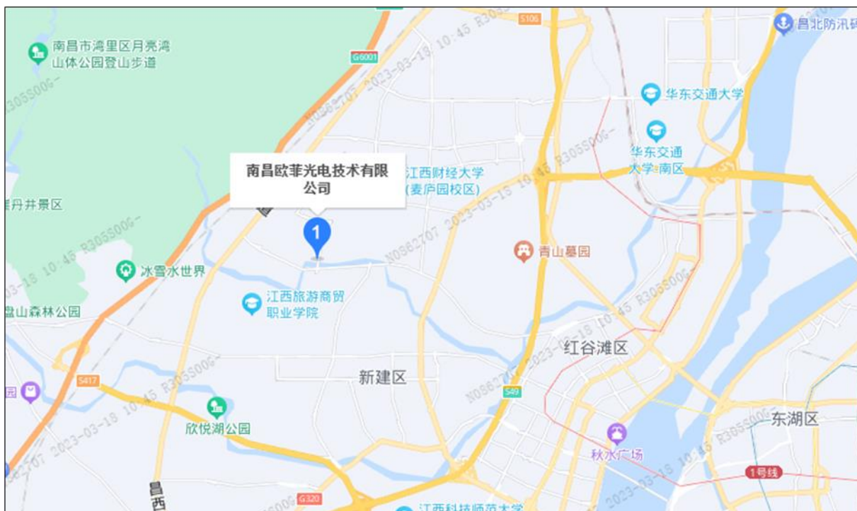
南昌欧菲光电技术有限公司 2025 年盘查地理位置图及区域平面图：